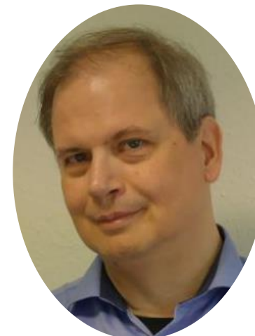
Dirk Steinhäuser Glatt Engineering GmbH